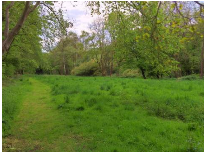
Unser Bogenplatz „Die lange Wiese“

Eine genaue Anfahrt für den PKW finden Sie auf der nächsten Seite.